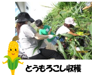
とうもろこし収穫