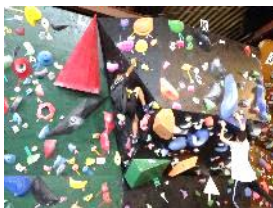
東館行楽 ホルダリング

而し施設に対する公的資金の導入により当然ながら行政の指導監督が年々きびしくなり逆に民間の住職さん方の声が小さくなり、加えて今日一般の事業者が福祉に参画するようになり、私は非常に寂しくむしろ疑念をもっております